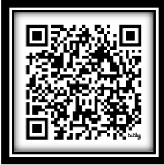
QR cara pembayaran UKT

Demikian pengumuman ini disampaikan untuk dapat dilaksanakan sebagaimana mestinya.